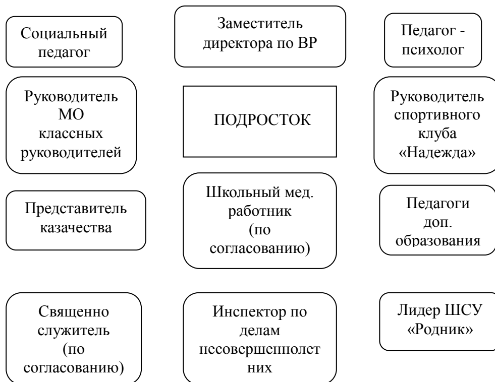
Схема взаимодействия членов ШВР по профилактической работе с несовершеннолетними, находящимися на различных видах учёта, в социально опасном положении.

В Законе обозначено определение понятия профилактической работы: индивидуальная профилактическая работа — деятельность по своевременному выявлению несовершеннолетних и семей, находящихся в социально опасном положении, а также по их социально-педагогической реабилитации и (или) предупреждению совершения ими правонарушений и антиобщественных действий.